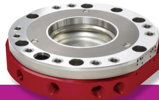
Model SWR2300 Zatížení: 230 kg (Max. 360 kg) Opakovatelnost: 0,003 mm

Vysoká pevnost spoje, odolná proti ohybu a krutu • Konstruován pro zatížení od 0,5 kg do 360 kg • Dlouhá životnost testovaná v řádu milionů výměnných cyklů • Garantovaná opakovatelná přesnost polohování v toleranci \pm 1,5 \mu\text{m} na jeden milion cyklů • Koncipován pro elektrické a pneumatické spoje • Bezúdržbové provedení