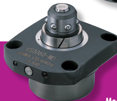
Model VS, VT, VSB, VSJ